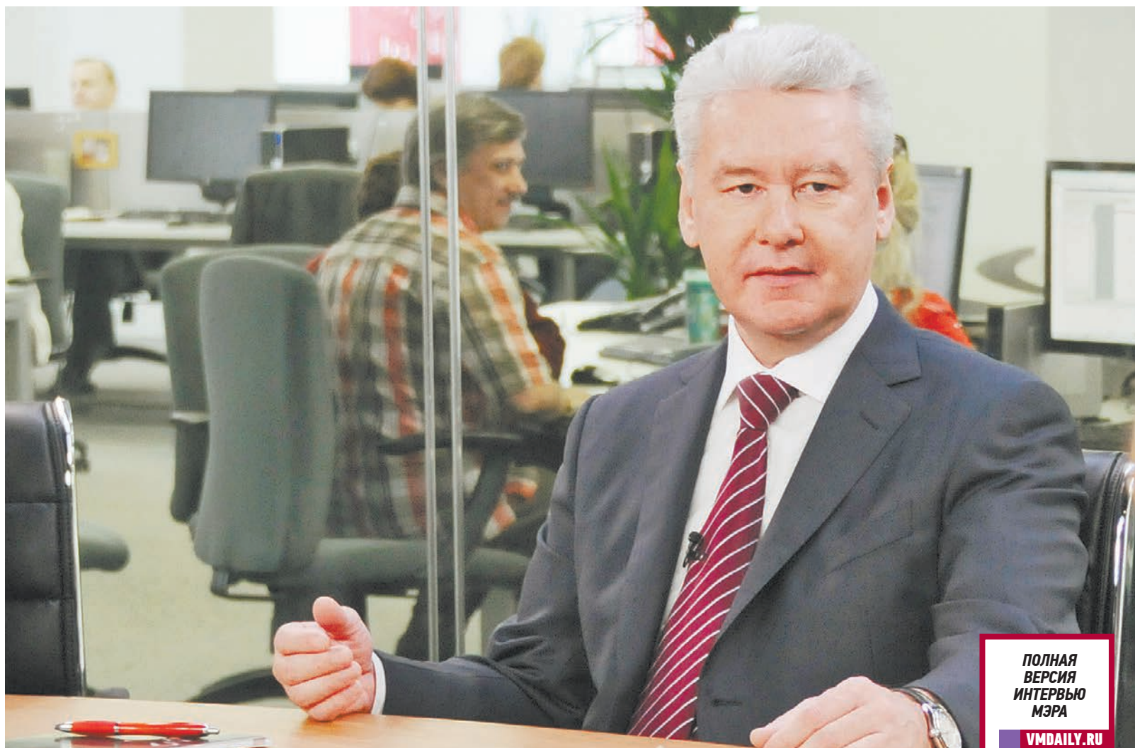
23 апреля 2012 года. Сергей Собянин рассказывает о новых территориях в телестудии газеты «Вечерняя Москва»

Он не должен развиваться сам по себе, а Москва сама по себе. Мы проводим сейчас разработку концепции развития всей агломерации: и новой территории, и старой территории Москвы, и ближайшего Подмосковья. Разработать такой план необходимо, причем с участием лучших урбанистов мира. Первоочередные же меры, которые не связаны с долгосрочным планированием: надо навести элементарный порядок по уборке дворов, подъездов, детских площадок, запланировать обустройство садовых участков и садовых поселков. К слову, садоводы много задавали вопросов и очень боялись, что мы придем и все снесем. Но мы настроены на то, чтобы благоустроить поселки, построить дороги, провести воду, свет и так далее. И конечно, надо забрать себе бюджетную сеть, которая обеспечивает необходимыми услугами, — здравоохранение, образование и так далее. Это текущая работа.